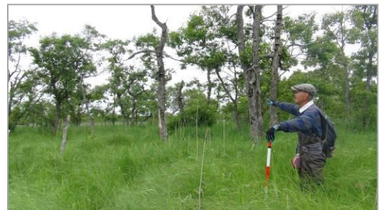
訪問予定のフィールドの様子