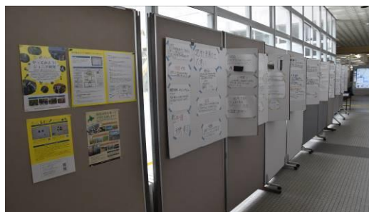
昨年度の展示会の様子（釧路市役所）