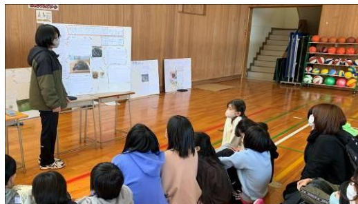
昨年度の発表会の様子（別保小学校）