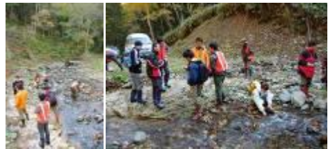
③尾札部川 林道終点